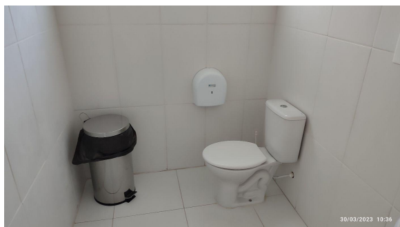
Banheiro não adaptado.