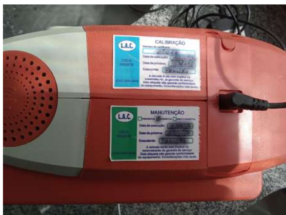
Etiqueta de calibração do desfibrilador

Comentários: A última calibração venceu em 2018.