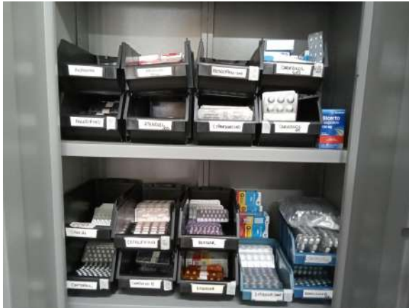
Estoque de medicamentos

E.2) A unidade oferta MÉTODOS CONTRACEPTIVOS?