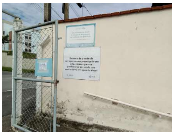
Corredor de entrada da USF

B.2) Foi detectado na data da fiscalização que esta UNIDADE se caracteriza por ser: (Selecione apenas uma alternativa)