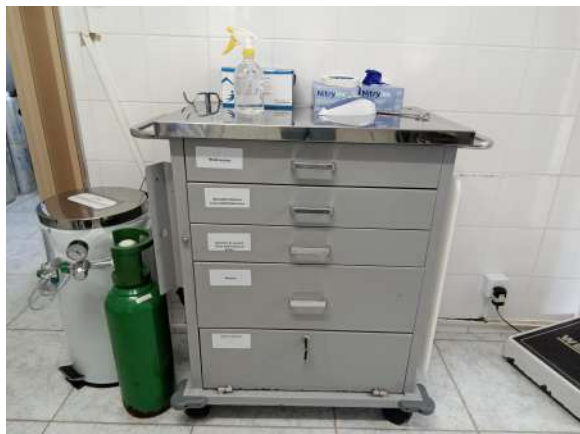
Carrinho de emergências

D.5) Em relação ao DESFIBRILADOR, foi detectado na data da fiscalização que: (Selecione apenas uma alternativa)