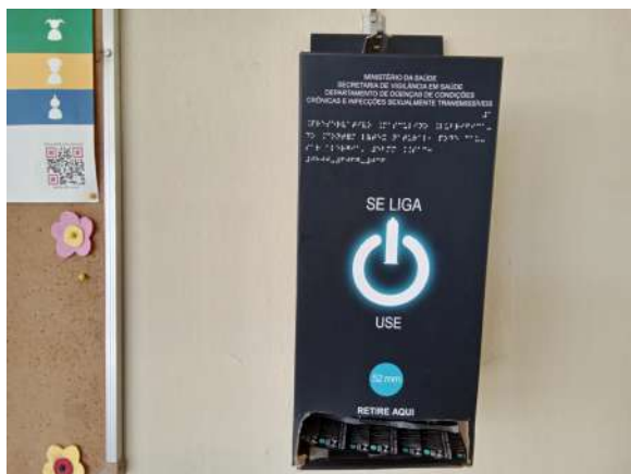
Dispenser de preservativo masculino