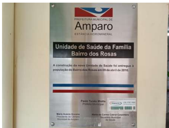
Placa de identificação