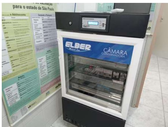
Refrigerador para vacinas