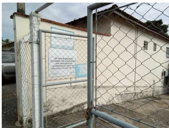
Portão de entrada da USF