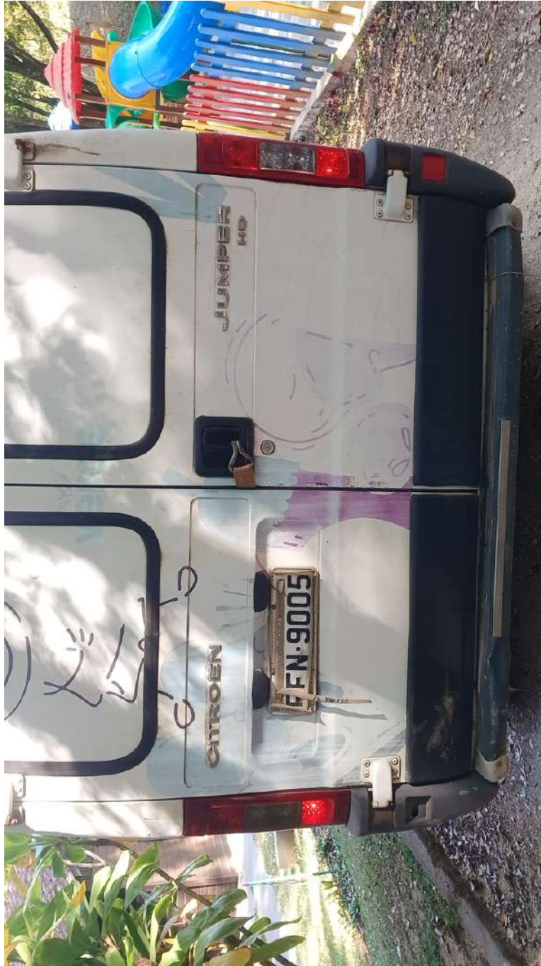
Foto traseira do veículo