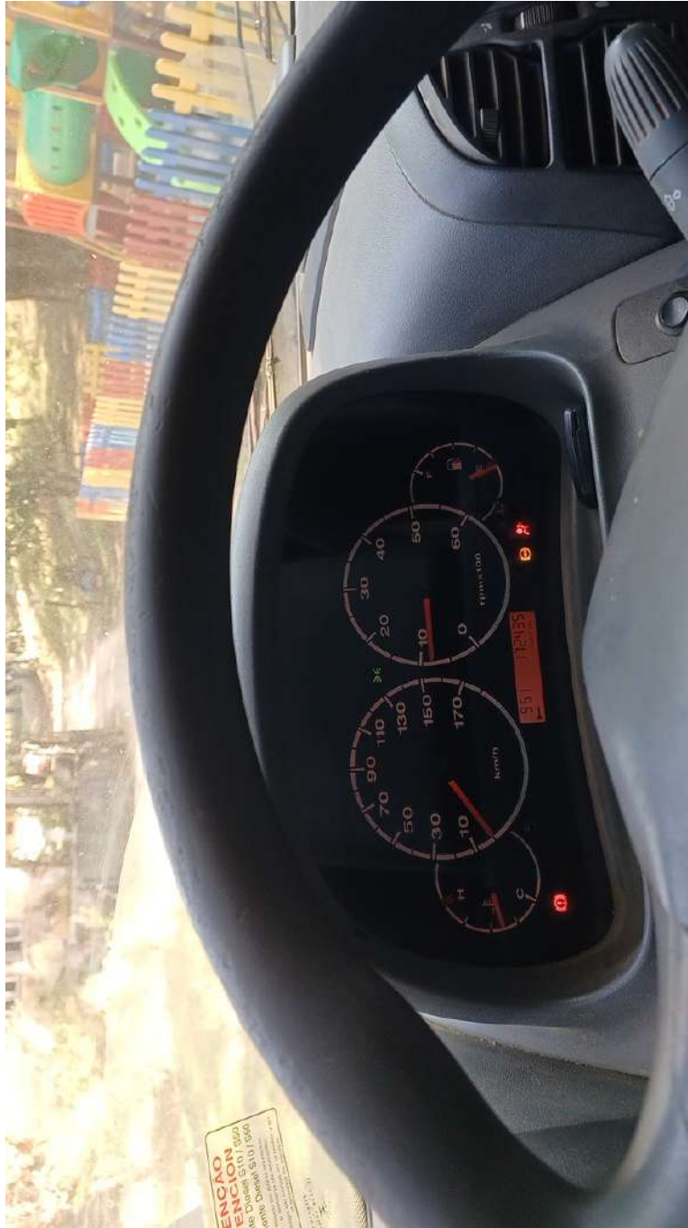
Foto do odômetro do veículo