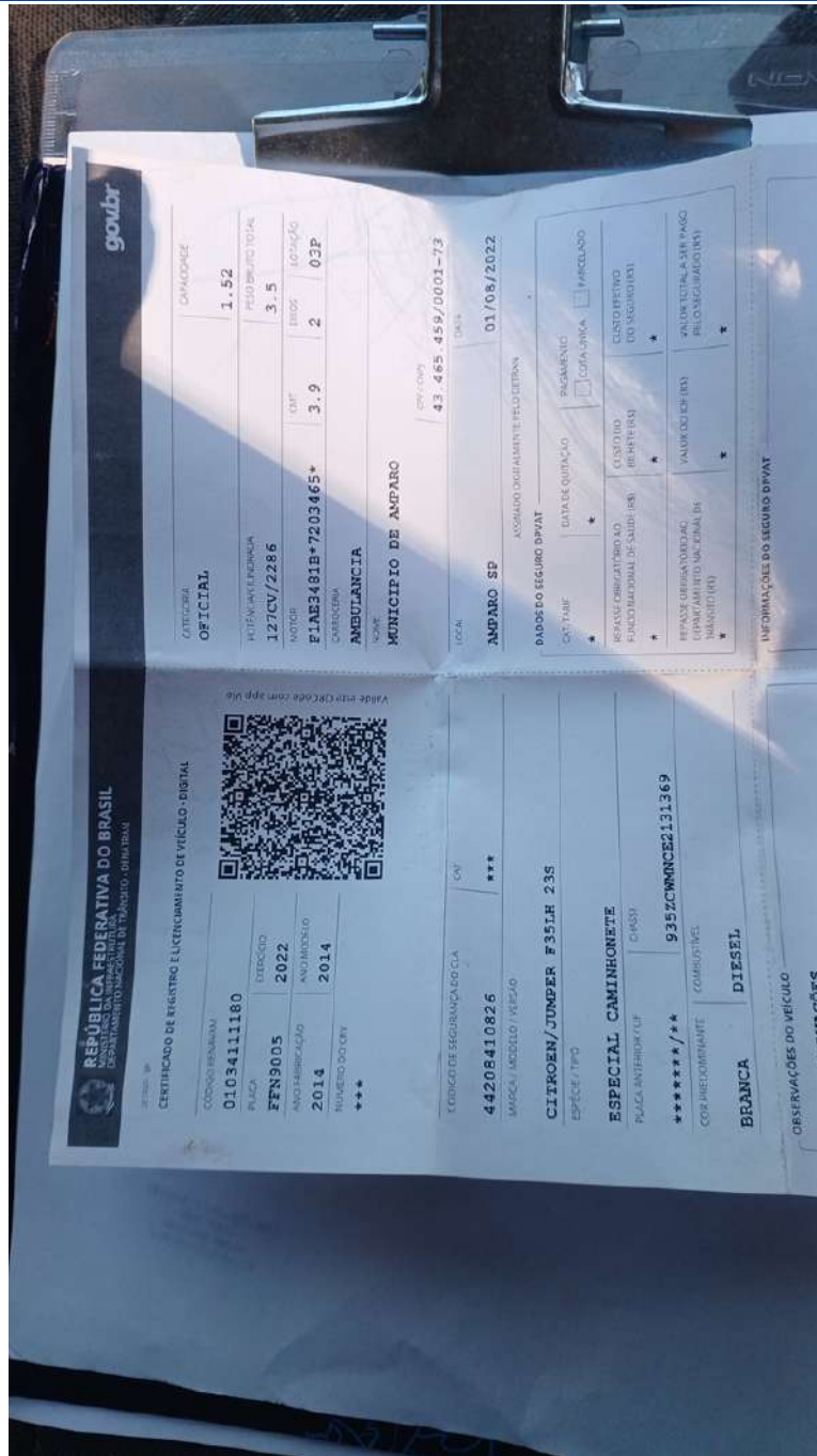
Foto documento do veículo