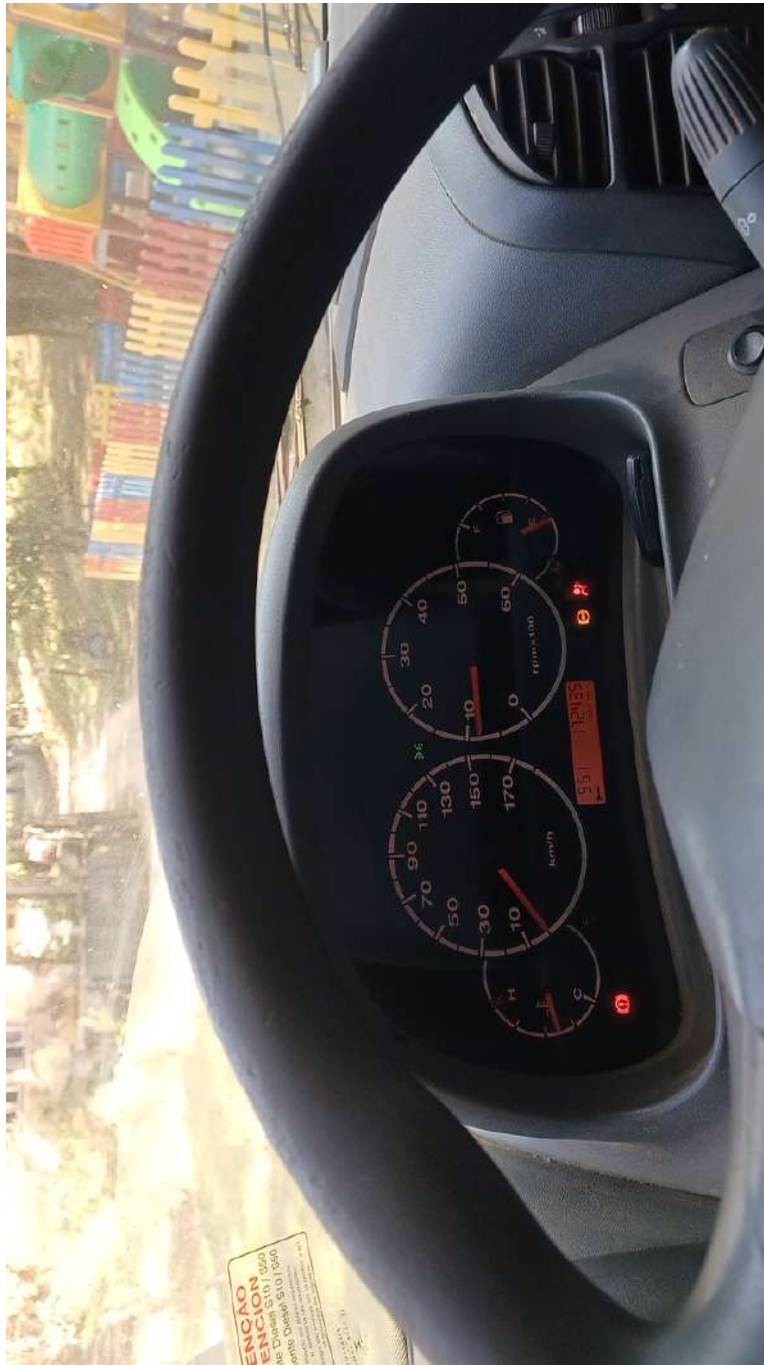
Foto do odômetro do veículo