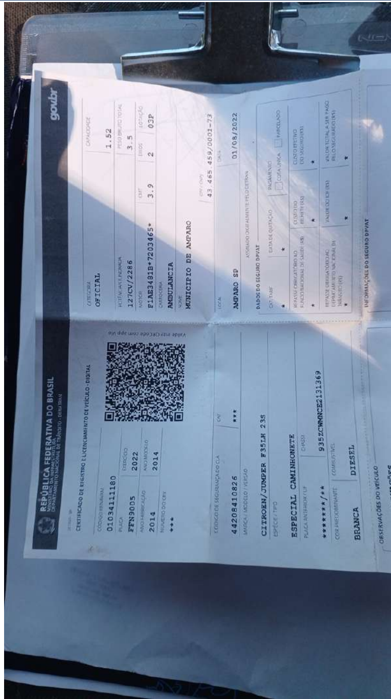
Foto documento do veículo