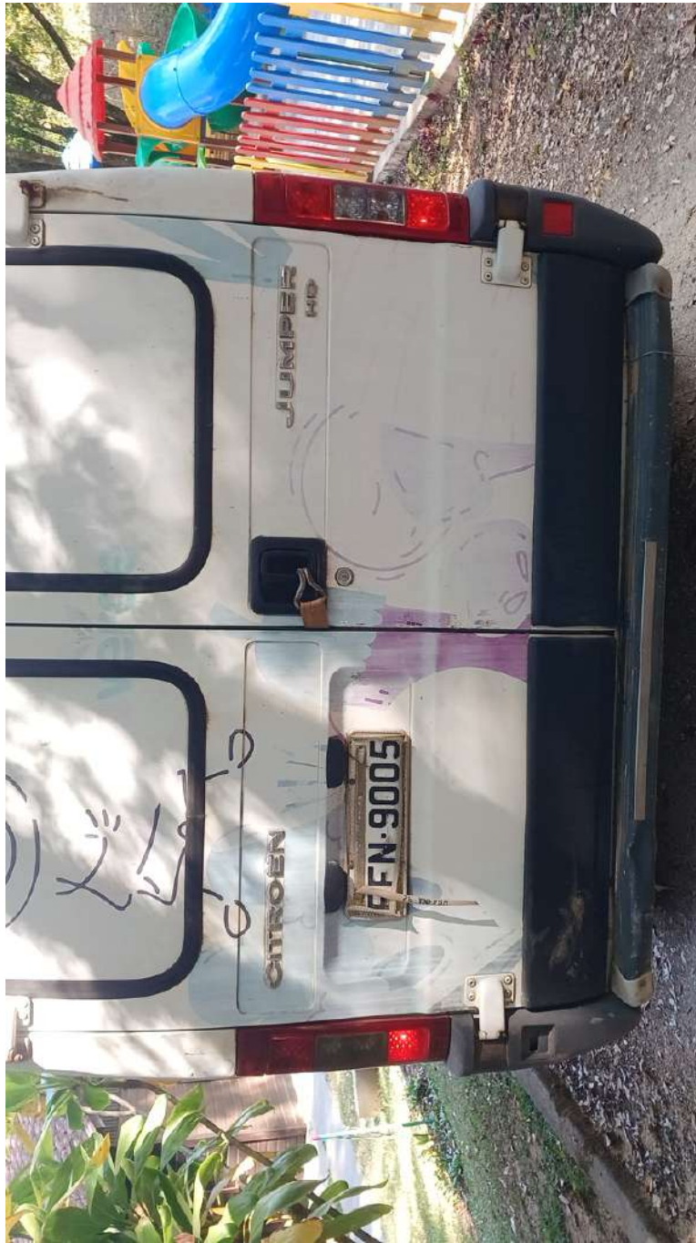
Foto traseira do veículo