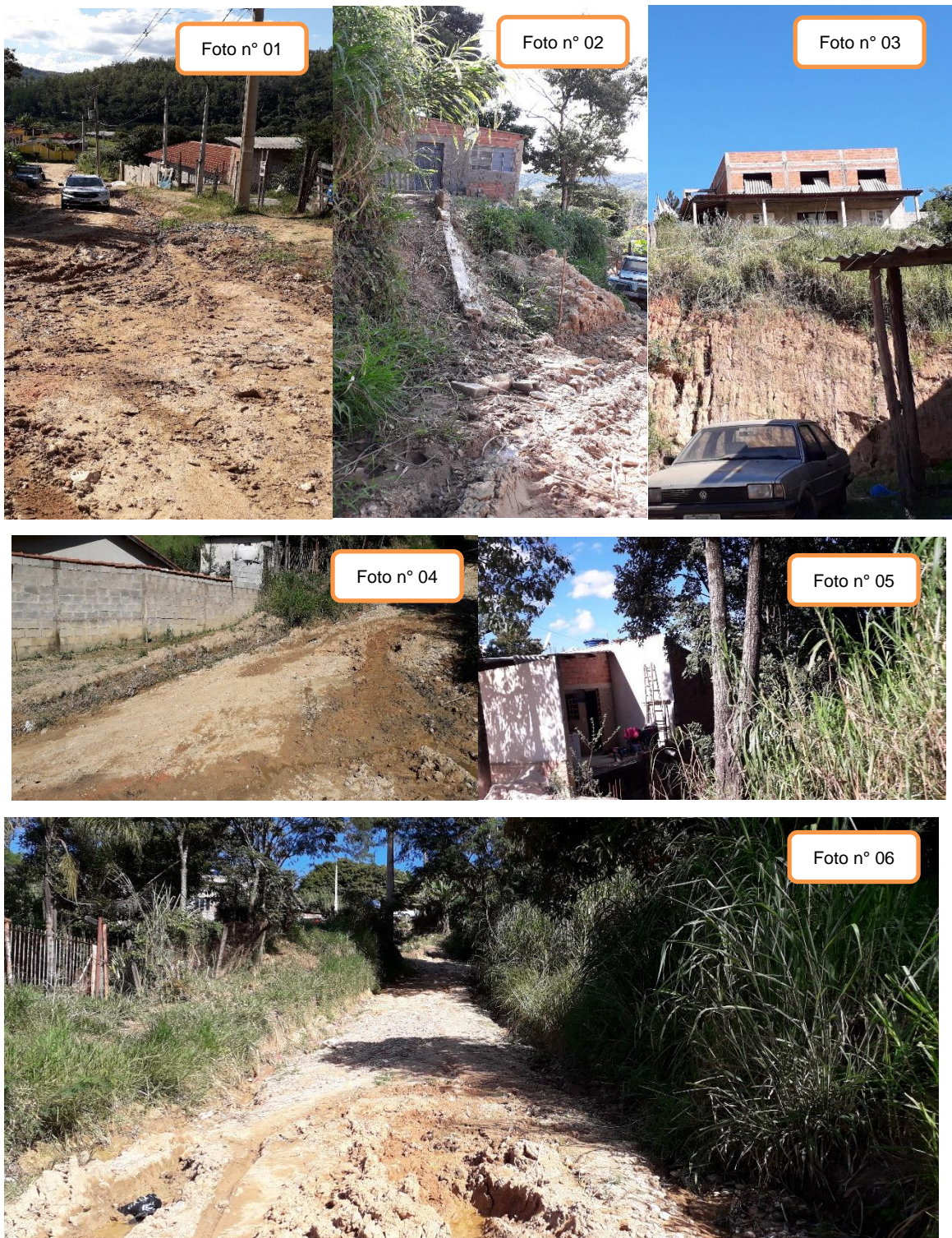
Fotos nº 01 a 06 - Planalto da Serra – Ausência de infraestrutura – ruas de terra (sem pavimentação ou tubulação de drenagem pluvial) em péssimas condições de trafegabilidade – construções em áreas de risco.