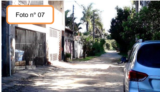
Foto nº 07

Já no Jardim Jaguari, durante a visita ao local, constatamos a existência de esgoto à céu aberto, ruas sem asfaltamento e entulho/lixo em local inadequado, conforme imagens abaixo: