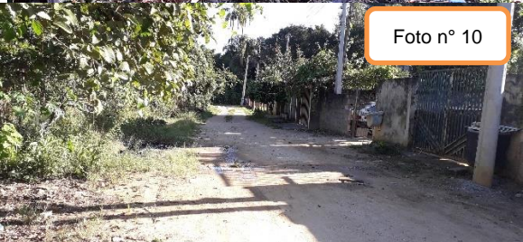
Foto nº 10