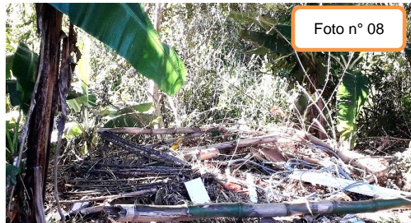
Foto nº 08