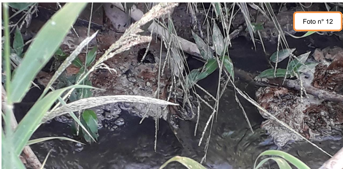
Foto nº 12

Fotos nº 07 a 12 – Bairro Jaguari – Ausência de infraestrutura – Esgoto à céu aberto – Descarte de entulhos e lixo em locais inapropriados.