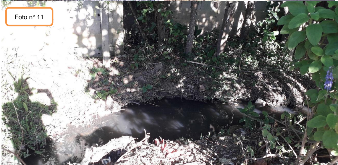
Foto nº 11