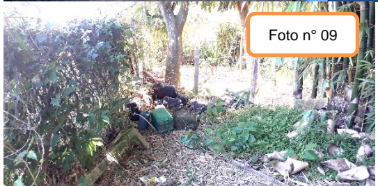
Foto nº 09