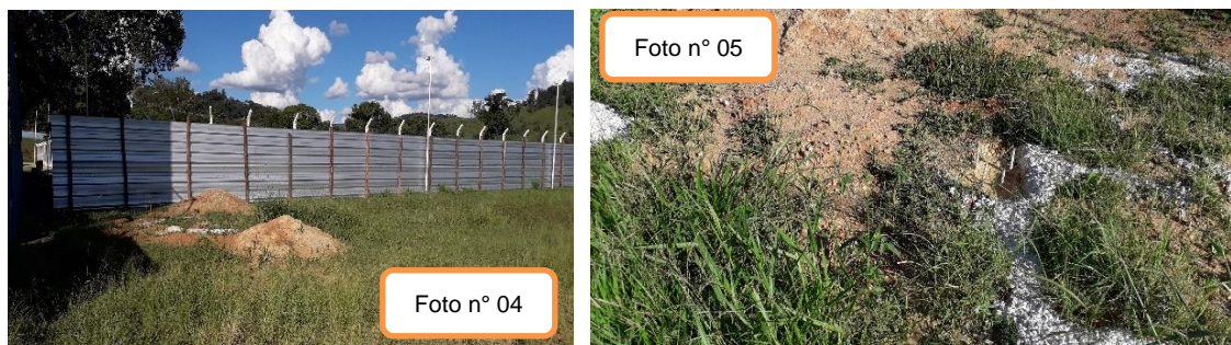
Fotos n° 02 a n° 05 – Na data da visita (11/04/23) ao local de realização da obra não havia quaisquer funcionários da empresa, havia apenas execução de serviços de fundação (Foto n° 05) e colocação de tapumes de metal.

Embora não tenham sido efetuados pagamentos (vide pesquisa às pp. 01/03 do DOC 19), a obra deveria ter sido iniciada em 29/06/2022 (vide informação na placa da obra), sendo a previsão de sua conclusão para 10 meses, quer seja, se o cronograma tivesse sido cumprido, a obra já estaria quase concluída na data da visita.