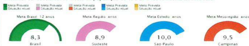
Indicador 8B-Escolaridade média da população de 18 a 29 anos residente na área rural

Fonte: Estado, Região e Brasil - PNAD - 2015 Fonte: Município e Mesoregião - IBGE/Censo Populacional - 2010