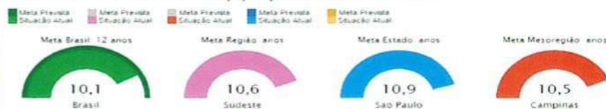
Indicador 8A-Escolaridade média da população de 18 a 29 anos de idade

Fonte: Estado, Região e Brasil - PNAD - 2015 Fonte: Município e Mesoregião - IBGE/Censo Populacional - 2010