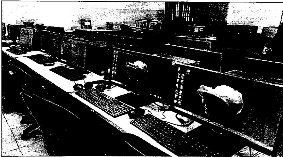
CIME Peter Pan, em 20.07.2023

Abaixo, destaca-se fotografias retiradas dos equipamentos, na data de 20.07.2023: