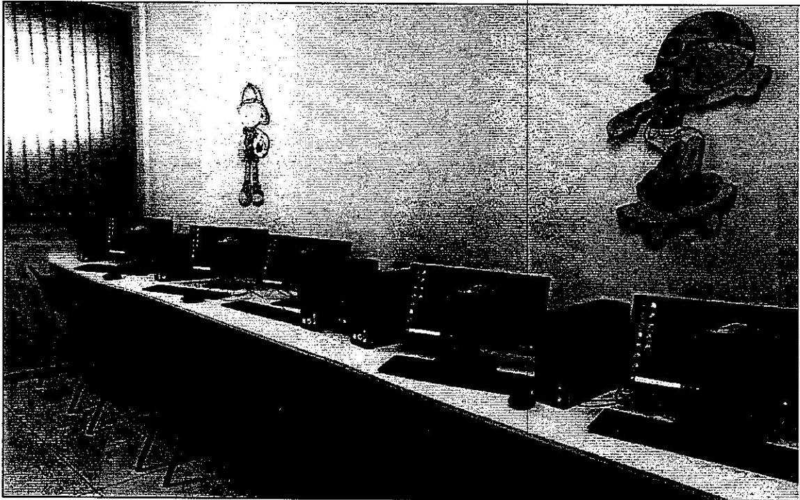
CIME Profª Jacyra Ribeiro Guilardi, em 20.07.2023

Sendo o que nos cabia informar no momento, colocamo-nos à disposição para eventuais esclarecimentos e necessidades de complementações.