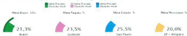
Indicador 12B: Taxa líquida de escolarização na graduação (TLE)