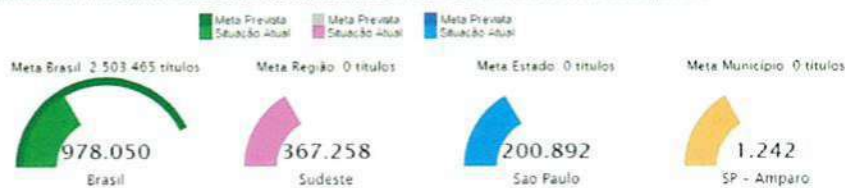
Indicador 11B-Número absoluto de matrículas em EPT de nível médio na rede pública.