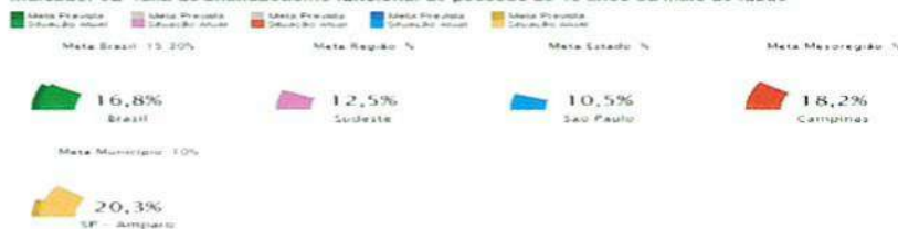
Indicador 9B-Taxa de analfabetismo funcional de pessoas de 15 anos ou mais de idade

Nota: O objetivo desse indicador é reduzir em 50% a taxa de analfabetismo funcional.