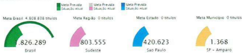
Indicador 11A-Número absoluto de matrículas em EPT de nível médio