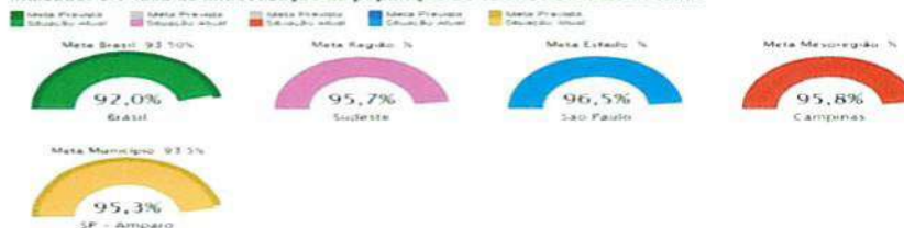
Indicador 9A-Taxa de alfabetização da população de 15 anos ou mais de idade