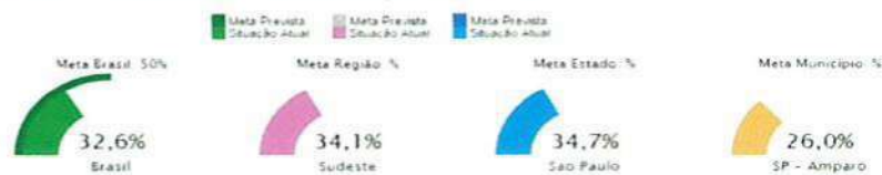
Indicador 12A: Taxa bruta de matrículas na graduação (TBM)

Fonte: Estado, Região e Brasil - PNAD - 2015 e Censo de Educação Superior 2015 Fonte: Município e Mesorregião - IBGE/Censo Populacional - 2010