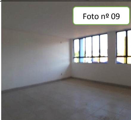
Foto nº 09