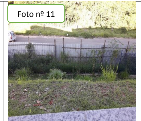
Foto nº 11