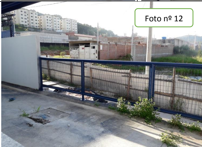
Foto nº 12