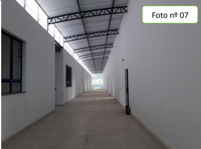
Foto nº 07