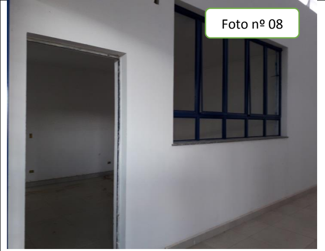
Foto nº 08