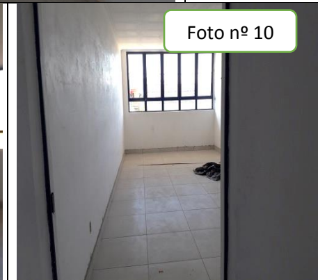
Foto nº 10