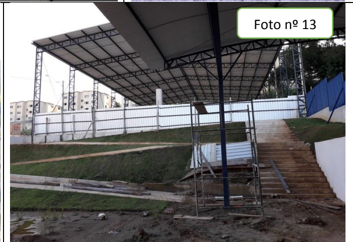
Foto nº 13