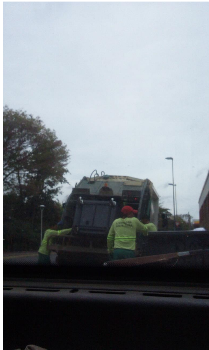
Foto 1 e Foto 2 – Coleta mecanizada realizada na Rodoviária de Amparo (área central) às 14h26 (1º contêiner) 14h31 (2º e 3º contêiner) do dia 08/08/22