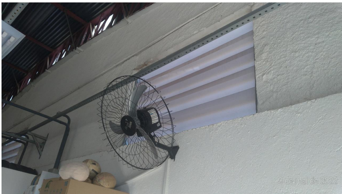
Foto 2 – Fechamento lateral do prédio com fechamento improvisado, por onde entra água em dias chuvosos.