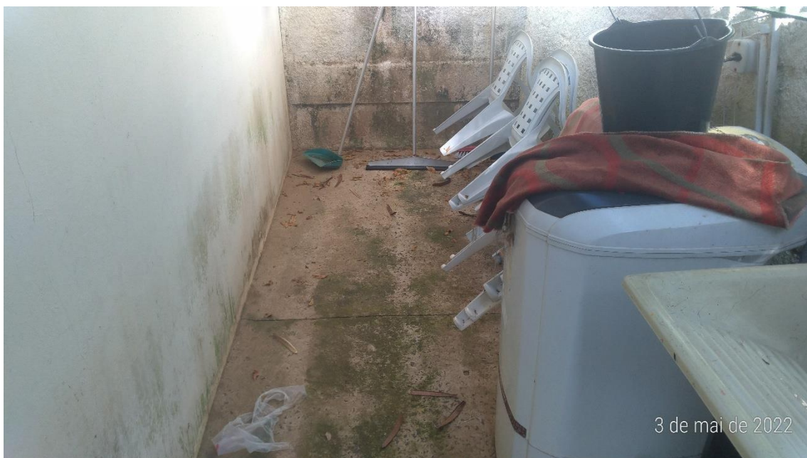
Foto 4 – Sujidades no local em decorrência da falta de reposição do pessoal da limpeza, afastado por questões médicas na data da visita.