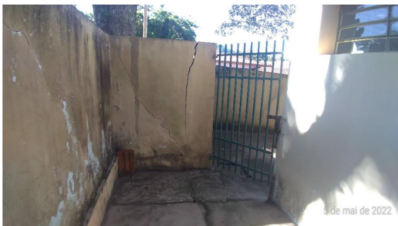
Foto 9 – Muro na parte externa bastante deteriorado, mofado, trincado e com pintura descascada.