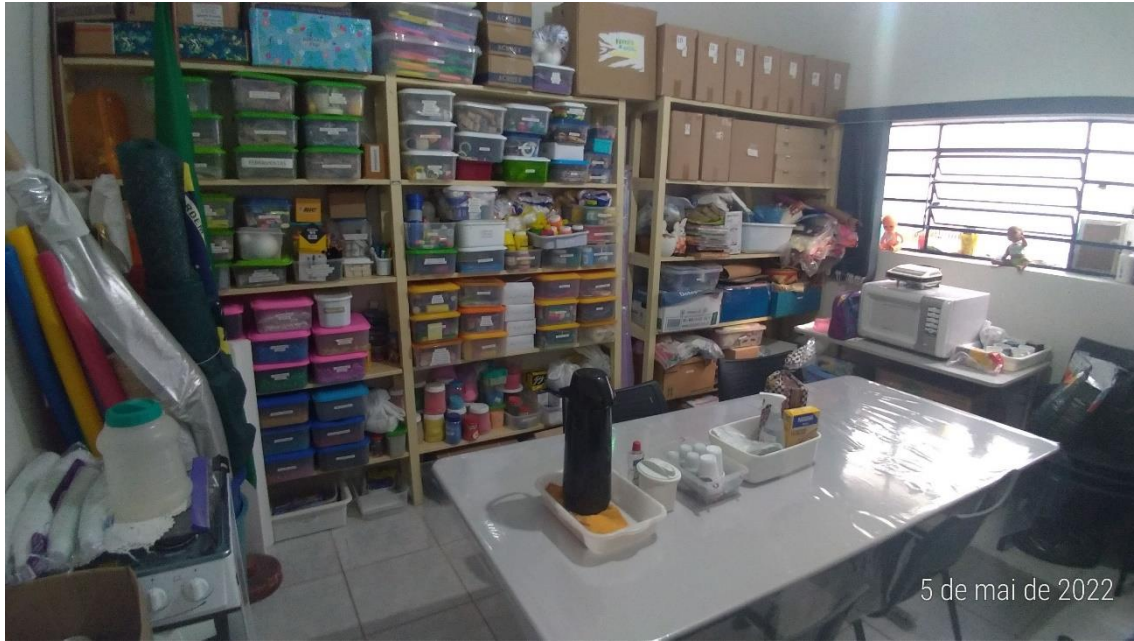
Foto 10 – Sala dos professores que também é usada para armazenamento de materiais escolares devido à falta de espaço adequado.