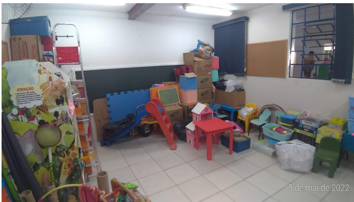
Foto 2 – Sala não utilizada para aulas, devido a receita quanto a sua integridade estrutural.