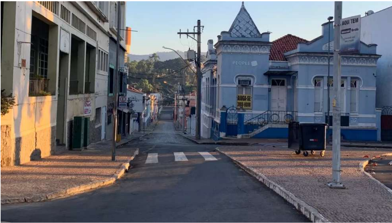
Amparo no 1º dia de lockdown, nesta sexta-feira (4)