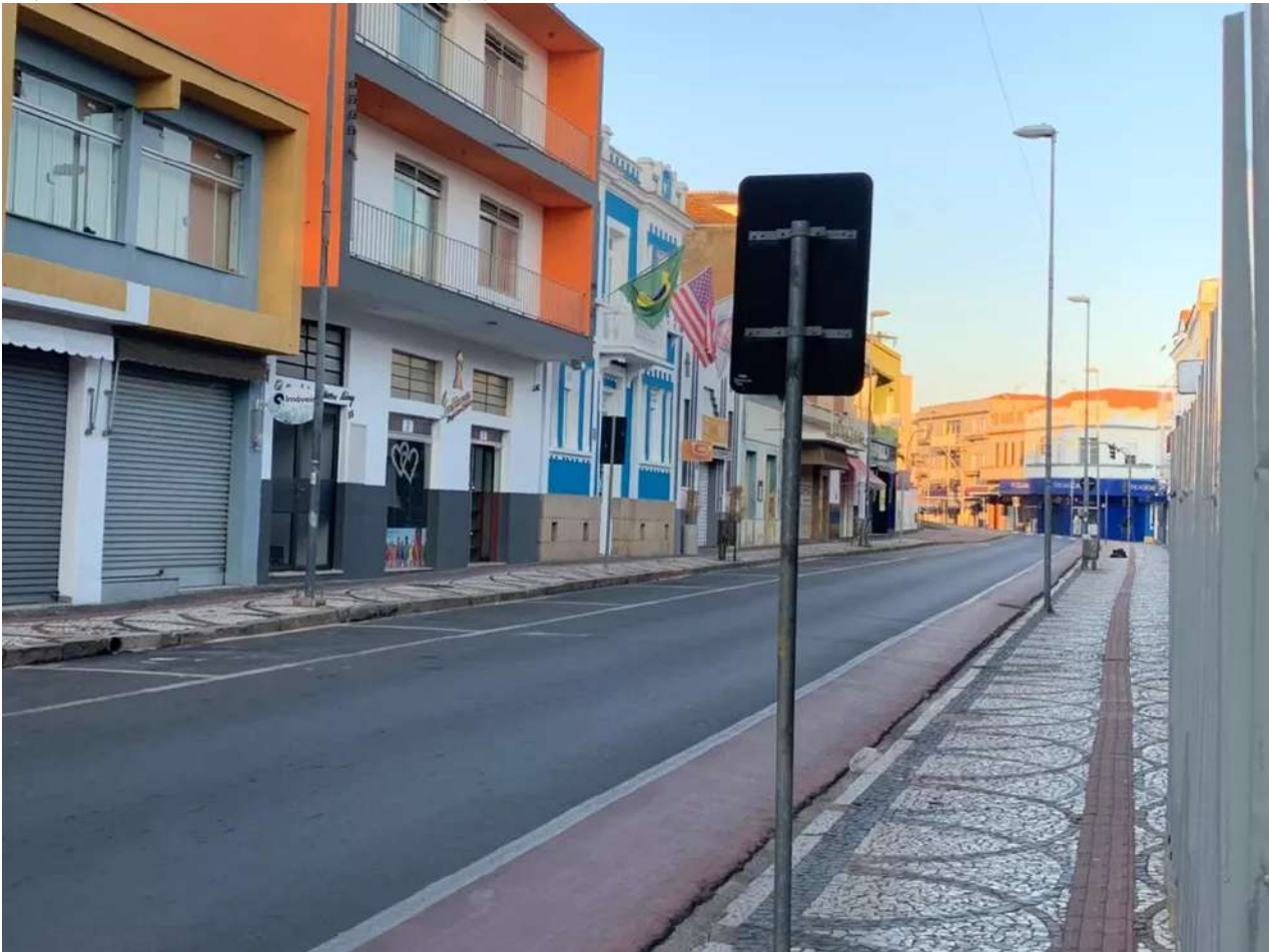
Amparo no 1º de lockdown, nesta sexta-feira (4)