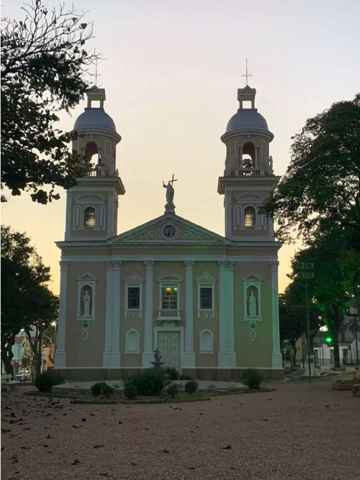
Amparo no 1º dia de Lockdown, nesta sexta-feira (4)