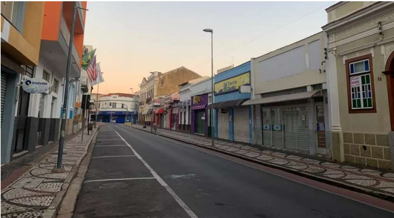
Amparo no 1º dia de lockdown, nesta sexta-feira (4)