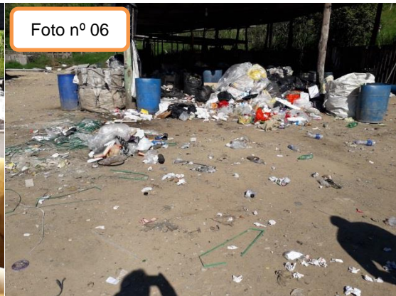
Foto nº 06

Fotos nº 01 a nº 06 – Imagens do galpão utilizado para realização dos serviços de separação dos resíduos, com estrutura singela, feita em madeira e diretamente no chão de terra, sem nenhuma parte em alvenaria.