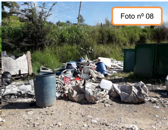
Foto nº 08

Fotos nº 07 e nº 08 – Imagem do local onde parte dos resíduos é queimada, demonstrando necessidade de orientação por parte dos setores competentes da municipalidade quanto a forma correta de descarte, a fim de se evitar eventuais contaminações.