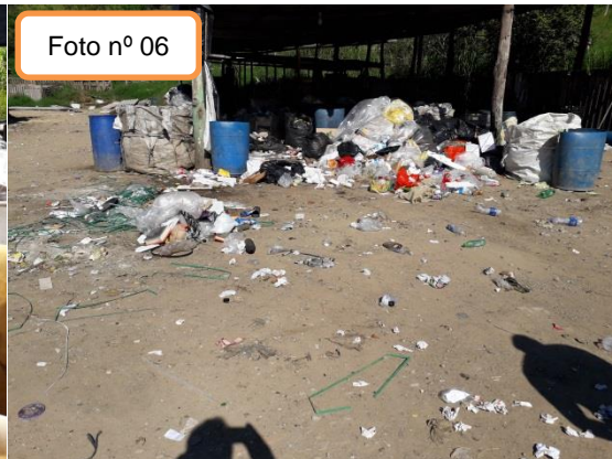
Foto nº 06

Fotos nº 01 a nº 06 – Imagens do galpão utilizado para realização dos serviços de separação dos resíduos, com estrutura singela, feita em madeira e diretamente no chão de terra, sem nenhuma parte em alvenaria.