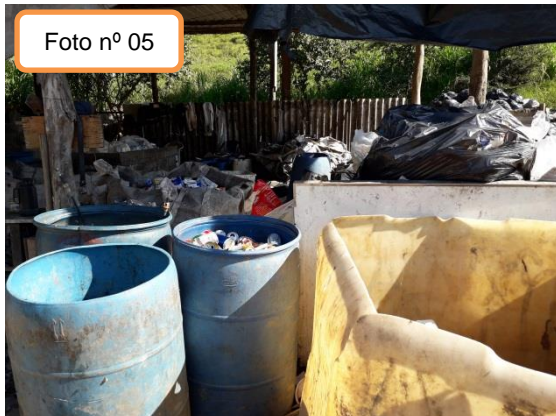
Foto nº 05