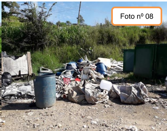
Foto nº 08

Fotos nº 07 e nº 08 – Imagem do local onde parte dos resíduos é queimada, demonstrando necessidade de orientação por parte dos setores competentes da municipalidade quanto a forma correta de descarte, a fim de se evitar eventuais contaminações.