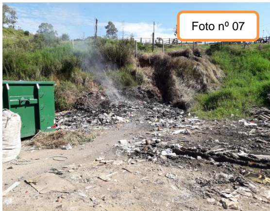
Foto nº 07

Fotos nº 01 a nº 06 – Imagens do galpão utilizado para realização dos serviços de separação dos resíduos, com estrutura singela, feita em madeira e diretamente no chão de terra, sem nenhuma parte em alvenaria.