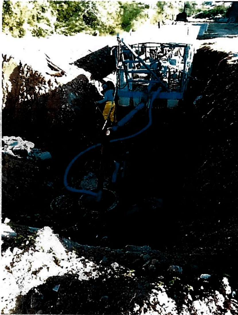
Figura 02 – Draga para o bombeamento do esgoto

Com o esgoto bombeado, deu-se início à instalação dos tubos de concreto e à reforma dos PVs.