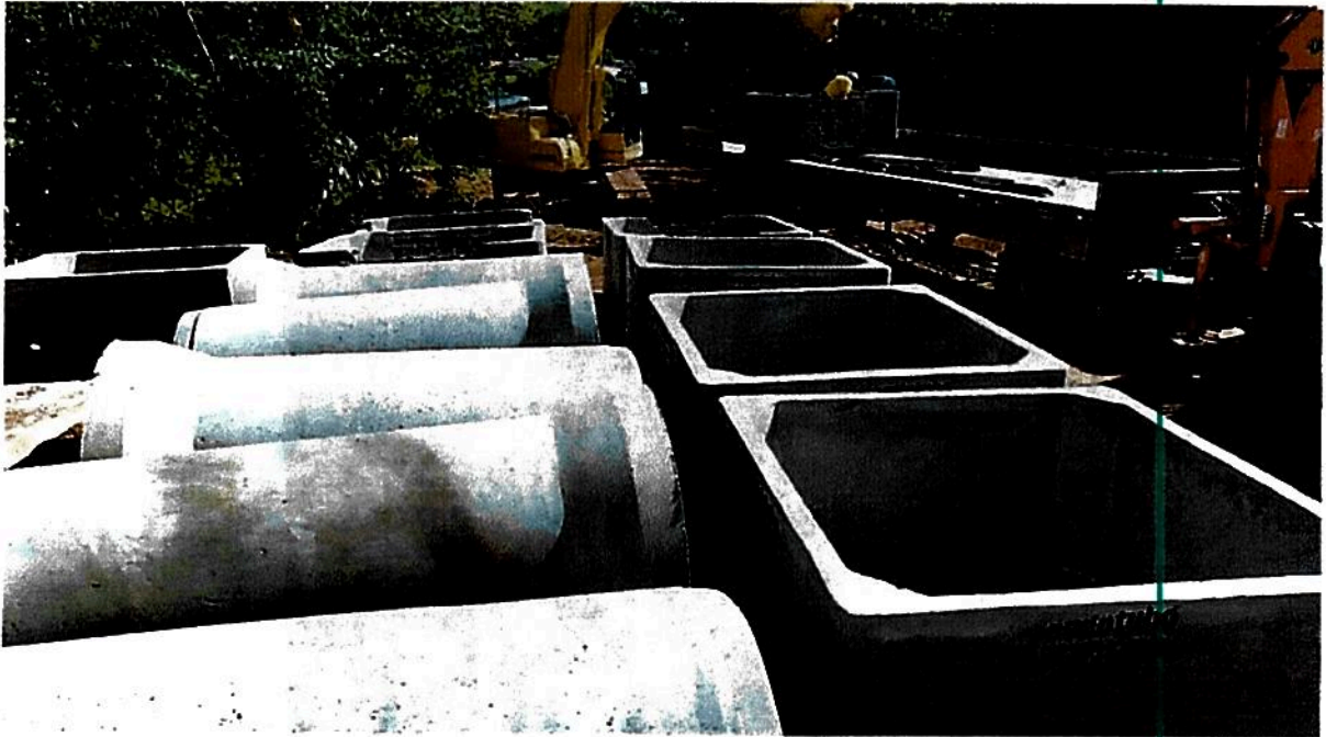
Figura 01 – Entrega dos materiais de concreto

Conforme informado no ofício enviado à CETESB em 28 de maio de 2019, no dia 25 do mesmo mês foram entregues os materiais de concreto necessários para a execução das obras destinadas a sanar o lançamento de esgoto in natura no córrego Santa Maria.