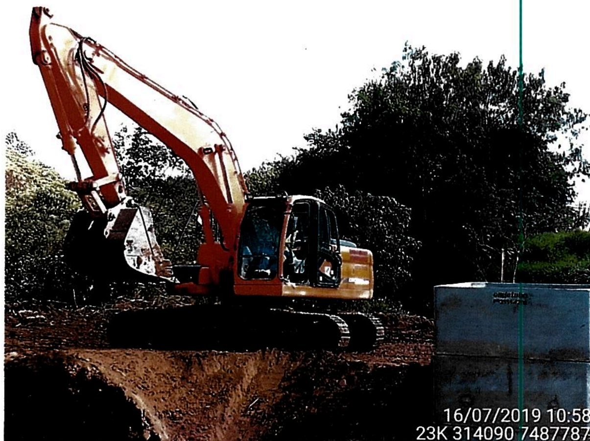
Figura 05 – Regularização da área de entorno

Devido à complexidade das obras a serem realizadas para que o problema fosse sanado, houve um pequeno atraso para a conclusão das mesmas. Porém, como pode ser observado nas fotos apresentadas, as obras foram finalizadas e não há mais o vazamento de esgoto in natura no córrego Santa Maria.