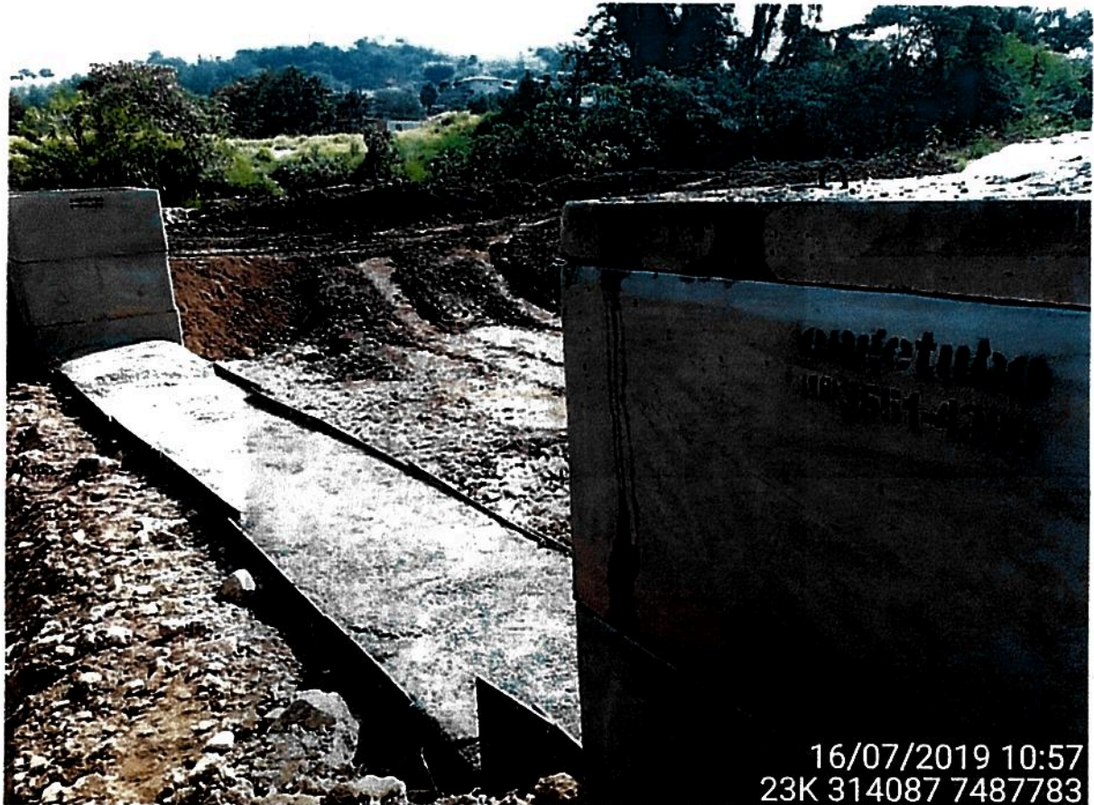
Figura 04 – Reforçamento da estrutura

Com as obras finalizadas, foi realizada a regularização das áreas de entorno para prevenir processos erosivos e consequente assoreamento do curso hídrico. Porém, é verificado que ainda há atividades no local devido a obras de infra estrutura realizadas pela Prefeitura Municipal de Amparo.