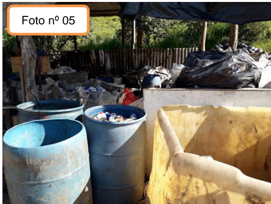
Foto nº 05