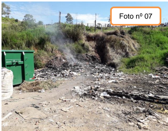
Foto nº 07

Fotos nº 01 a nº 06 – Imagens do galpão utilizado para realização dos serviços de separação dos resíduos, com estrutura singela, feita em madeira e diretamente no chão de terra, sem nenhuma parte em alvenaria.