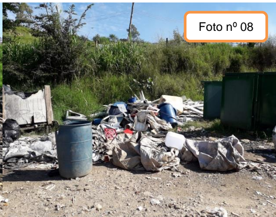
Foto nº 08

Fotos nº 07 e nº 08 – Imagem do local onde parte dos resíduos é queimada, demonstrando necessidade de orientação por parte dos setores competentes da municipalidade quanto a forma correta de descarte, a fim de se evitar eventuais contaminações.