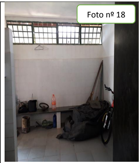
Foto nº 18

Fotos nº 09 a nº 18 – Fotos da área administrativa, com equipamento de aferição do peso dos caminhões de coleta, mesa improvisada para café e banheiro/vestiário com necessidade de reparos.