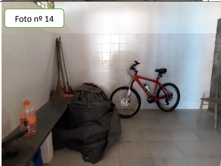
Foto nº 14