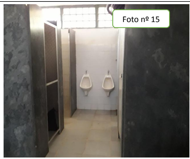
Foto nº 15