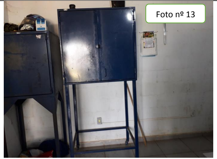
Foto nº 13