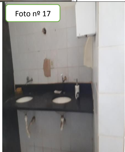
Foto nº 17