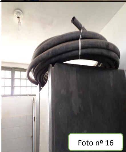
Foto nº 16