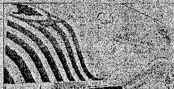
Paciente deverá ter de 35 a 49 anos e apresentar o pedido médico, o RG e cartão do SUS

Respeito Dignidade e Cidadania Comunidade e Trabalho Respeito e Trabalho Respeito e Trabalho